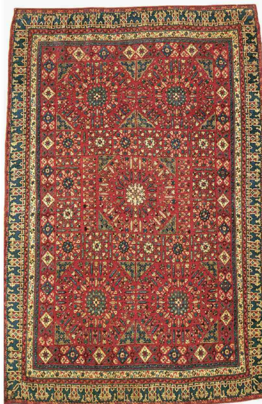
SOPRA: tappeto a medaglioni radiali detto "damascino", Siria (?), inizi del XVI secolo, cm 207x141. SOTTO, DA SINISTRA: "Madonna dell'ombrello", olio su tela di Girolamo dai Libri (1470 circa-1555); "Nascita di Maria", olio su tela di Vittore Carpaccio (1465 circa-1526).

Nella pittura mariana. Per impreziosire l'ambientazione, il tappeto compare spesso nei dipinti associati al culto della Vergine Maria. A tal proposito,